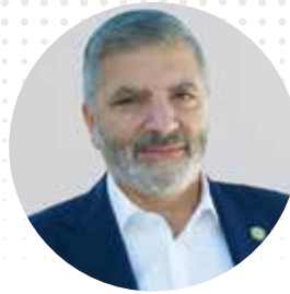
Γεώργιος Πατούλης Περιφερειάρχης Αττικής

Η ψηφιακή και ψηφιοποιημένη συνεργασία με το γαλλικό κράτος σε θέματα δημόσιας διοίκησης είναι ένα από τα «κλειδιά» της επιτυχίας των μεταρρυθμίσεων που πραγματοποιήθηκαν και με τη στήριξη της Ευρωπαϊκής Επιτροπής σε μια κρίσιμη εποχή, προκειμένου να οδηγηθεί η χώρα σε ένα βιώσιμο αύριο, αφήνοντας οριστικά πίσω τις παθογένειες του παρελθόντος.