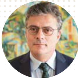
Ανδρέας Ποττάκης Συνήγορος του Πολίτη

Η συνεργασία του Συνηγόρου του Πολίτη με την Expertise France ξεκίνησε το Φθινόπωρο 2016, όταν δόθηκε η δυνατότητα στην Αρχή να επεξεργαστεί ένα ολοκληρωμένο μοντέλο θεσμικής διαμεσολάβησης, ως διαδικασίας εξωδικαστικής επίλυσης των διαφορών των πολιτών με τη Δημόσια Διοίκηση. Γρήγορα, έγινε αμοιβαία αποδεκτό, ότι η συνεργασία αυτή θα μπορούσε να συμβάλει καθοριστικά στην αναβάθμιση της αποτελεσματικότητας και αποδοτικότητας των υπηρεσιών του Συνηγόρου του Πολίτη.