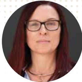
Maryvonne Le Brignonen

Διευθύντρια του Εθνικού Ινστιτούτου του Δημόσιου Τομέα (Institut national du service public)