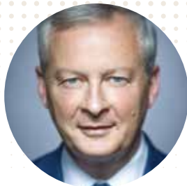
Bruno Le Maire

Υπουργός Οικονομίας, Οικονομικών και Βιομηχανικής και Ψηφιακής Κυριαρχίας